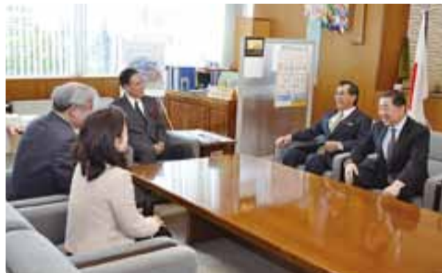
垣内議長とともに知事へのあいさつ 平成29年3月