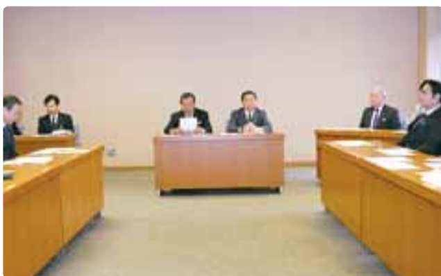
県議会各派交渉会 平成29年4月