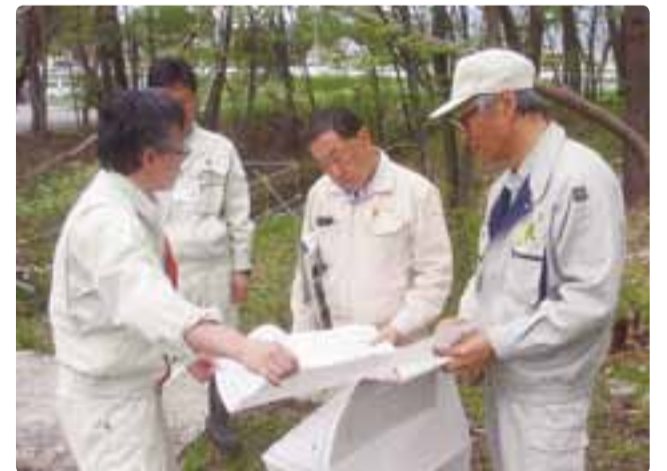
北アルプス地域振興局農地整備課現地調査 平成29年5月