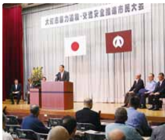
大町市暴力追放・交通安全推進市民大会 平成28年7月