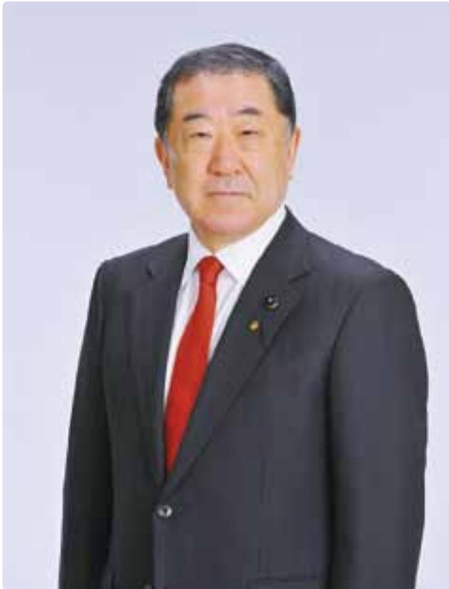
第95代長野県議会副議長に就任 平成29年3月