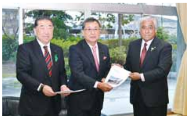
副議長として木曽郡町村会からの要望を受け取る 平成29年4月