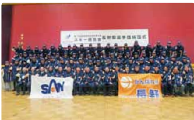
第72回国民体育大会冬季大会スキー競技会開始式 平成29年2月