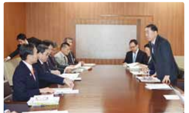
会派新ながの・公明の新年度予算編成知事要望 平成29年1月