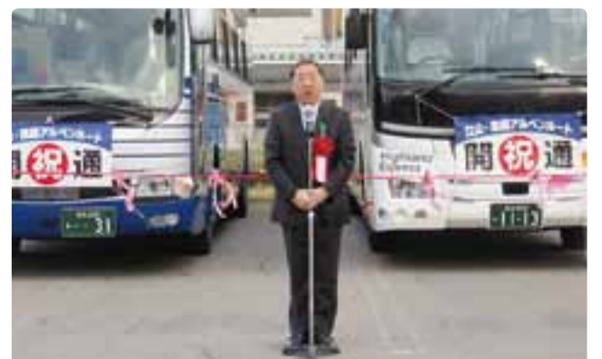
立山黒部アルペンルート開通式 平成29年4月