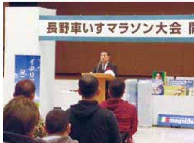
第13回長野車いすマラソン大会開会式 平成29年4月