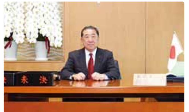
副議長室での撮影 平成29年5月