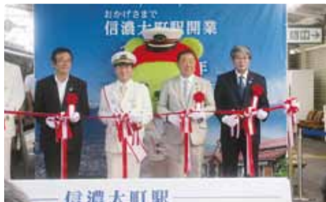
信濃大町駅開業100周年記念式典 平成28年7月