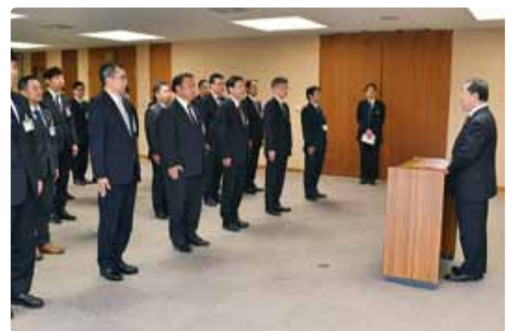
副議長として県議会議務局職員への訓示 平成29年3月