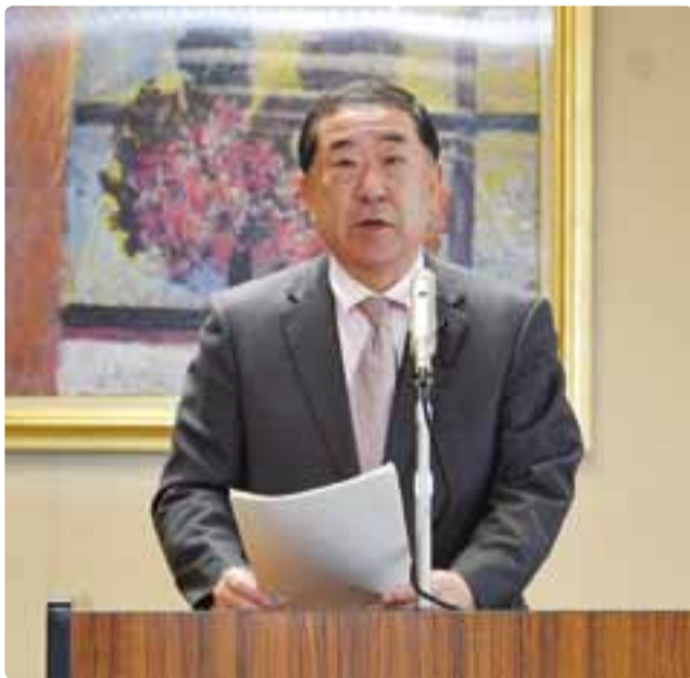
県議会副議長選挙に立候補 平成29年3月