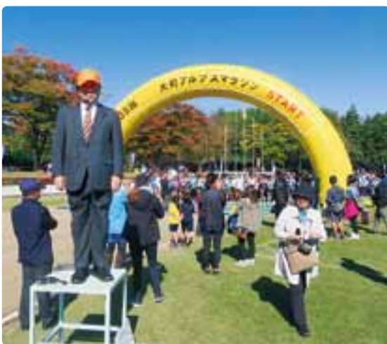
第35回大町アルプスマラソン 平成30年10月