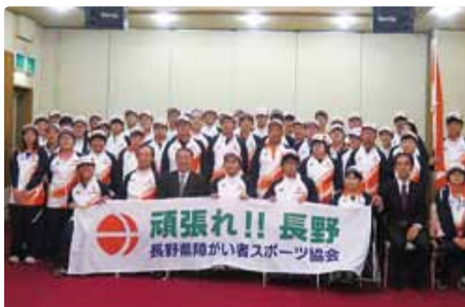
愛媛県で開催の全国障害者スポーツ大会 長野県選手団結団式 平成29年10月