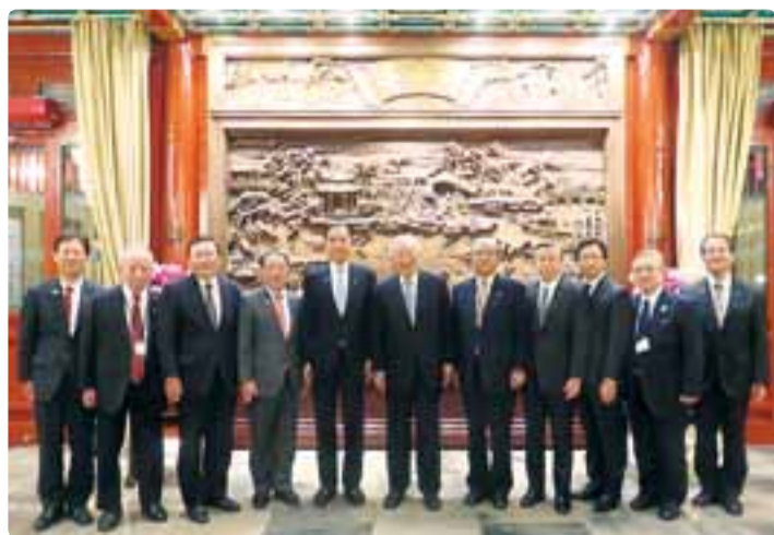
長野県日中国交正常化45周年記念訪中事業での北京訪問 平成29年10月