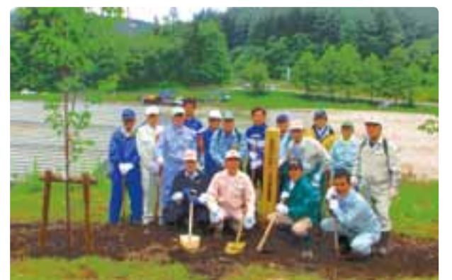
大北地区森林祭 平成30年5月