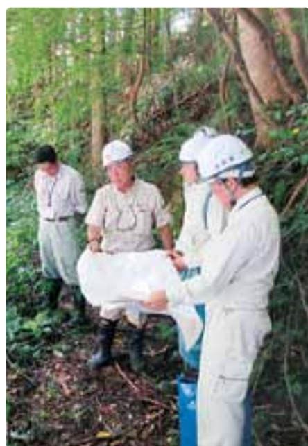
大町建設事務所現地調査 平成30年7月