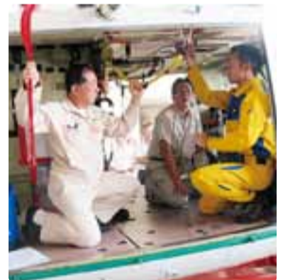
消防防災航空センターの視察 平成30年9月