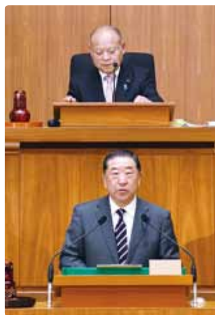
副議長退任の挨拶 平成30年3月