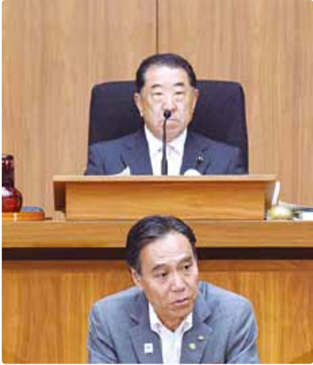
県議会本会議で議長を務める 平成29年6月