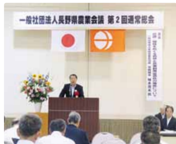
長野県農業会議通常総会 平成29年6月