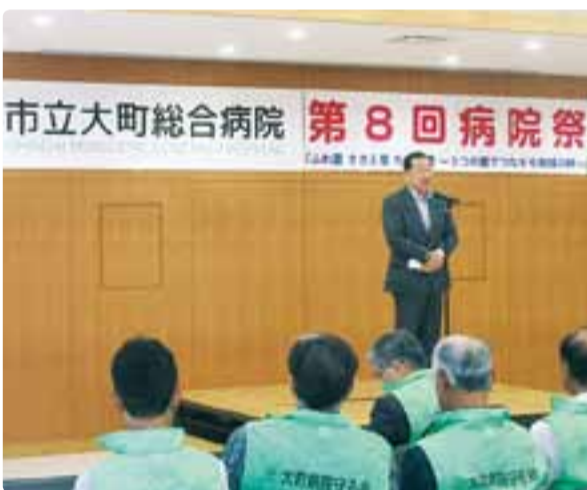
市立大町総合病院 第8回病院祭 平成30年5月