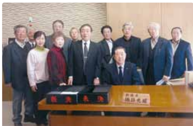
後援会の皆様と副議長室での撮影 平成30年3月