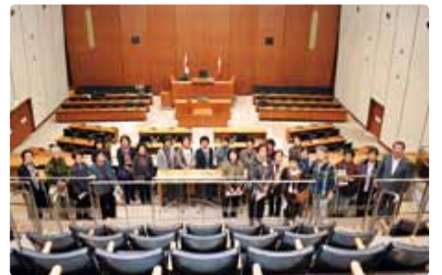
大町市の女性グループの皆様の県議会棟の案内 平成30年9月