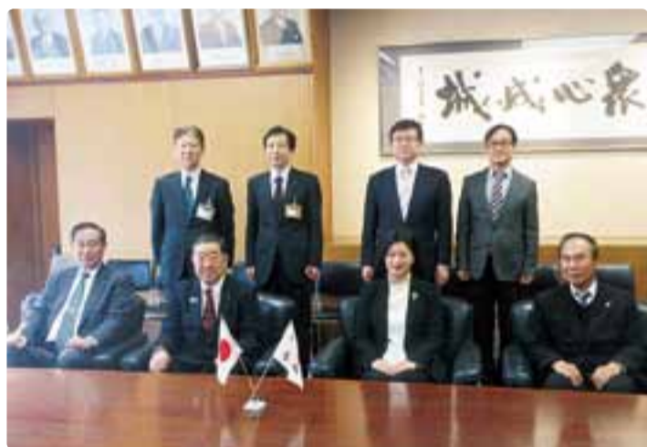
駐新潟大韓民国新総領事の県議会表敬訪問 平成30年1月