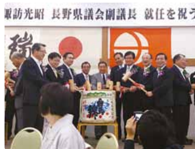
長野県議会副議長 就任を祝う会 平成29年7月