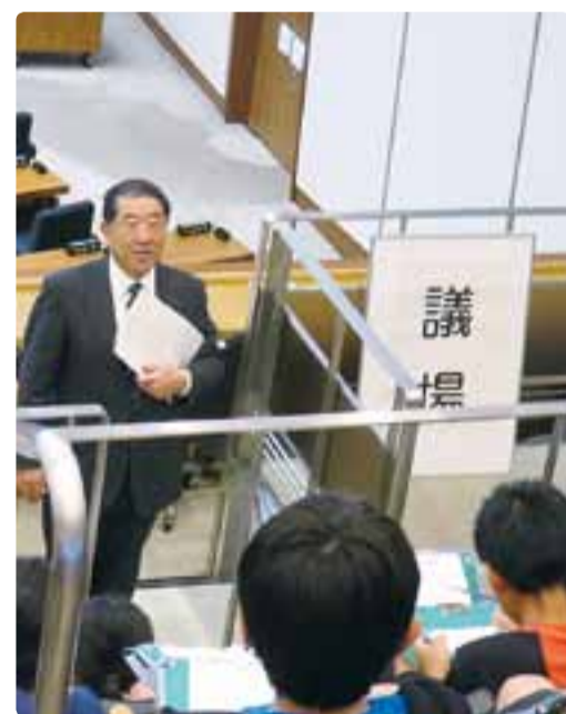
大町北小学校の県議会棟見学案内 平成29年9月