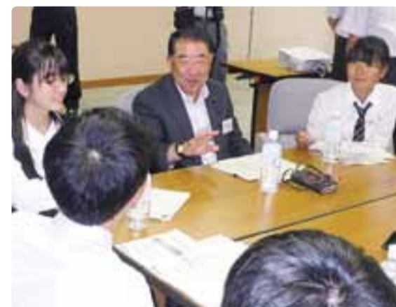
こんにちは県議会です 大町岳陽高等学校 平成29年8月