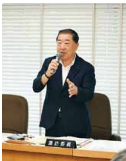
危機管理建設委員会 平成30年6月